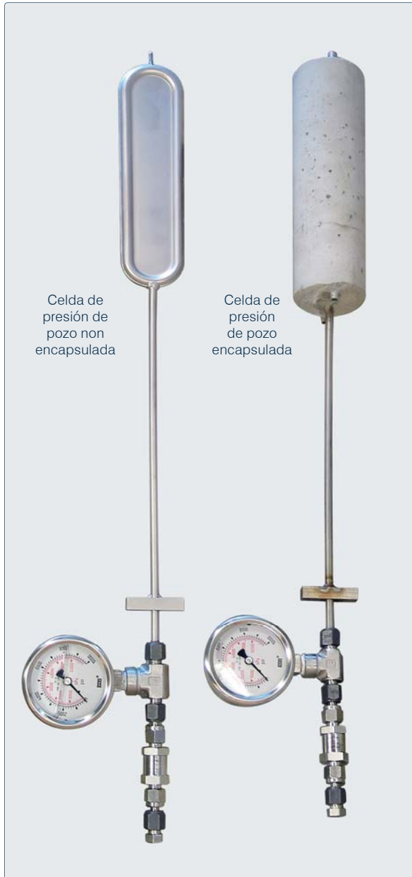
Celda de presión de pozo non encapsulada

En rocas que muestran un deslizamiento plástico, la celda no solo medirá el cambio de esfuerzo, sino también la presión a equilibrio final se aproxima al esfuerzo in situ.